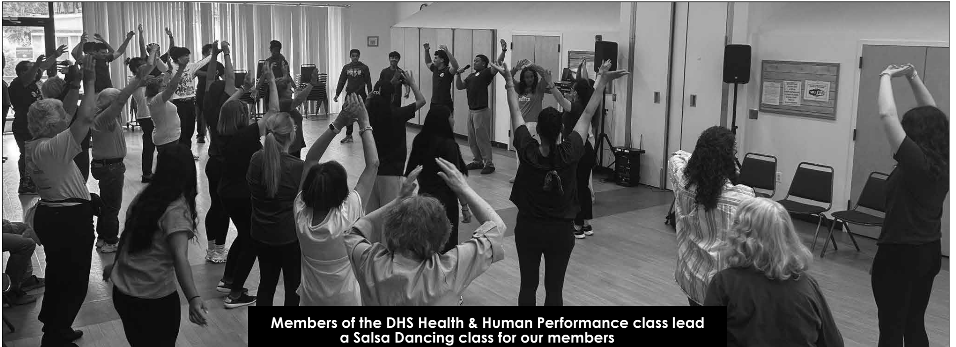
Members of the DHS Health & Human Performance class lead a Salsa Dancing class for our members

June is bustin' out all over, as the Rodgers and Hammerstein tune goes. The beautiful weather is here to stay! At least for a little while. The Danbury Senior Center and its programs for those over 60 are taking full advantage. In addition to many of our indoor programs here at Elmwood Hall, we're moving outside for some very special programs.