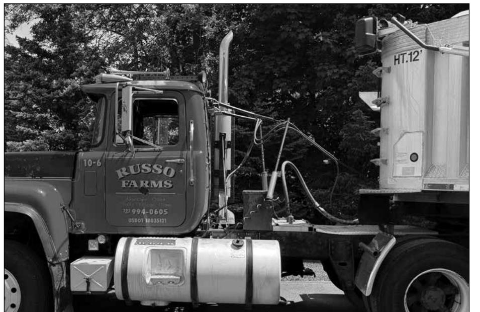
Russo Farms delivering soil