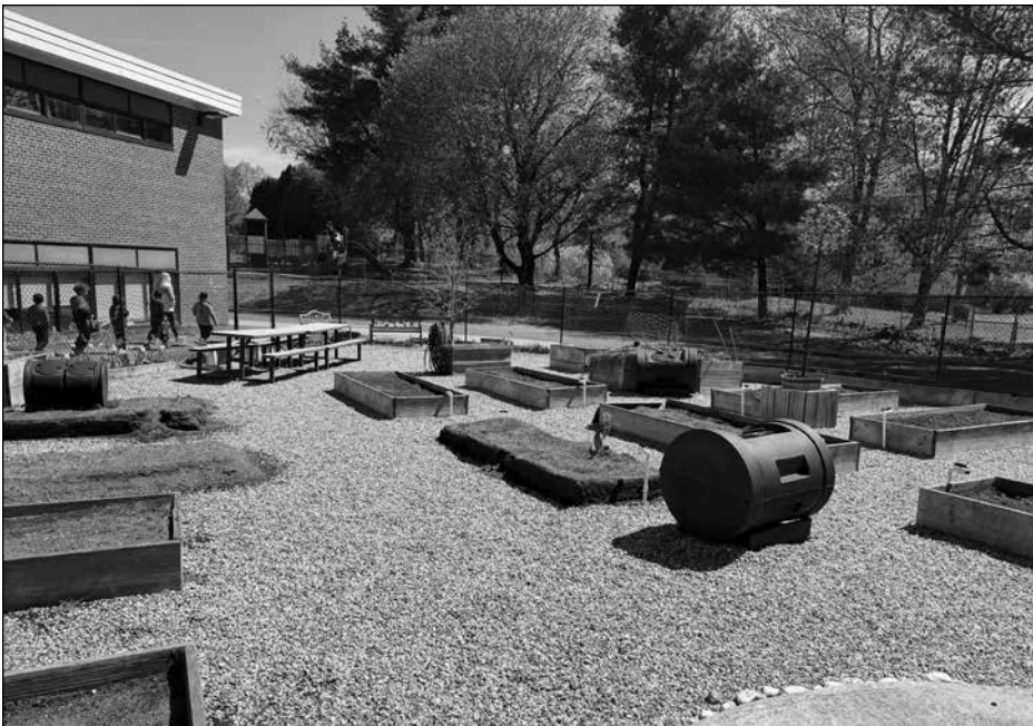
Garden beds ready to go at Park Avenue School