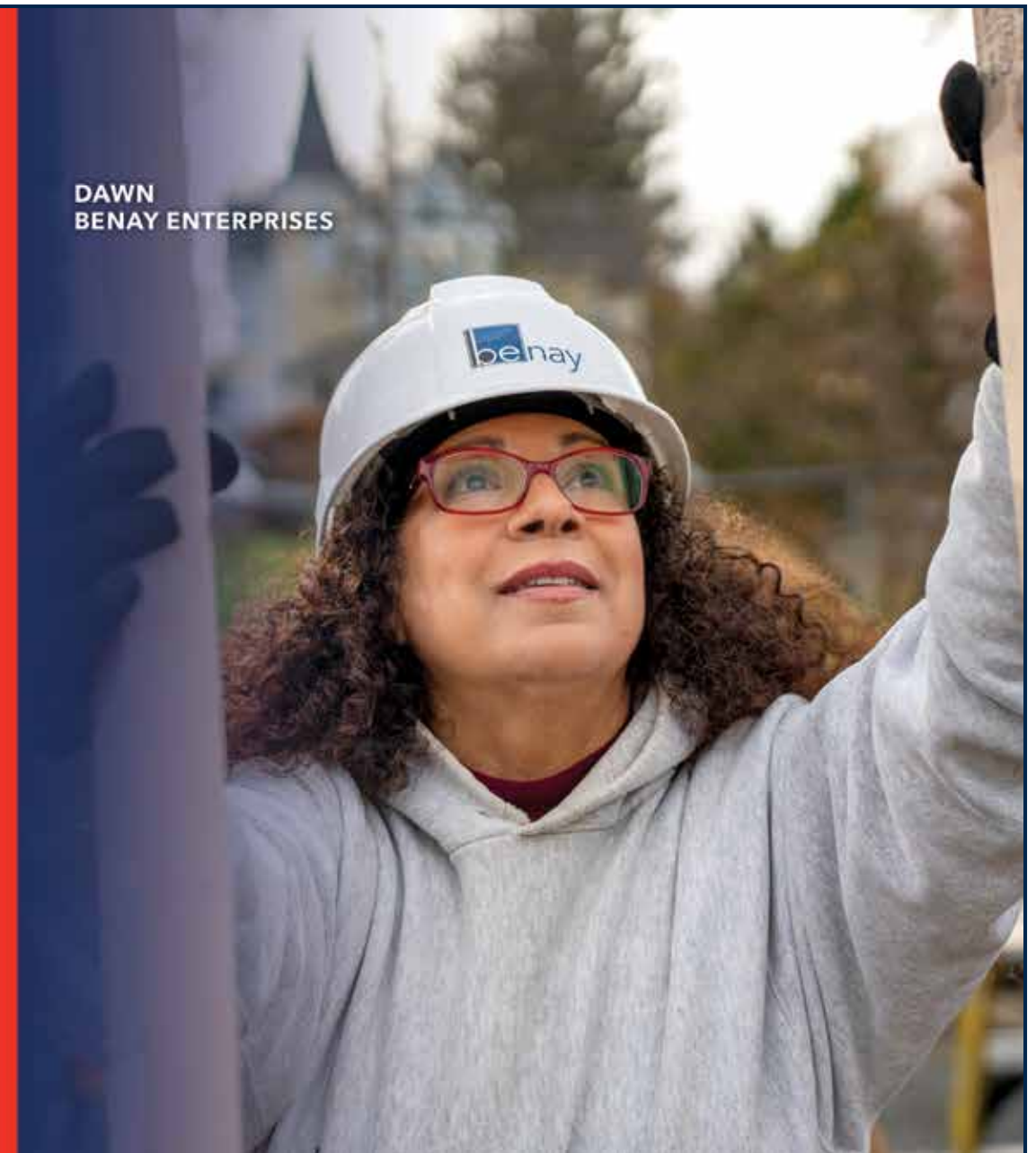
DAWN BENAY ENTERPRISES