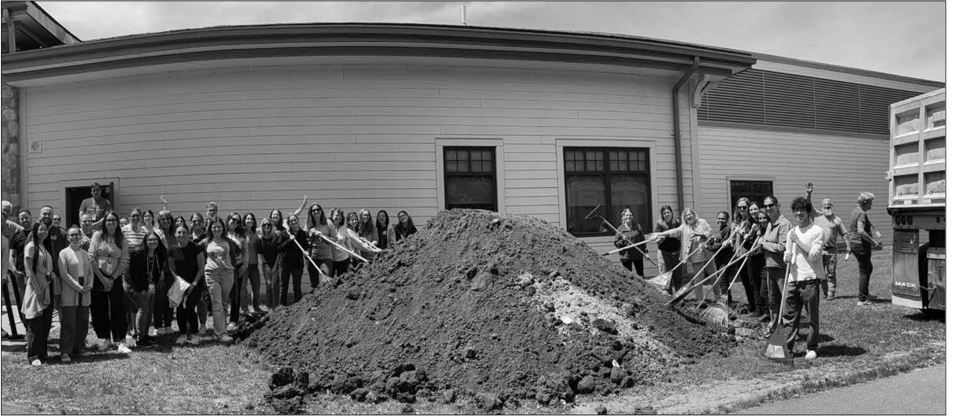
Teachers at the Ellsworth Avenue school getting ready to garden