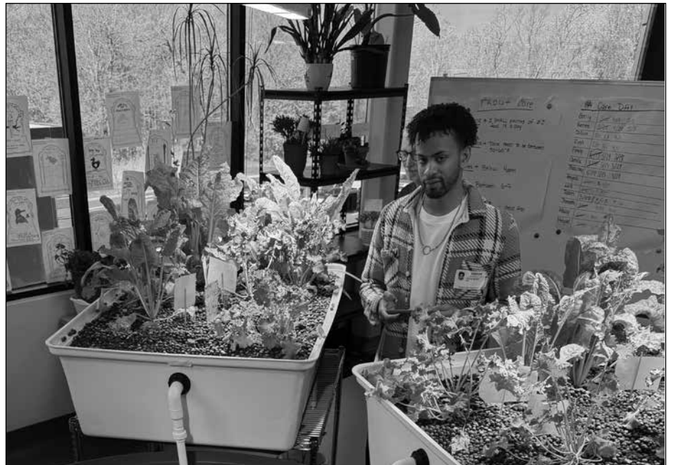
Aquaponics at Danbury High School West