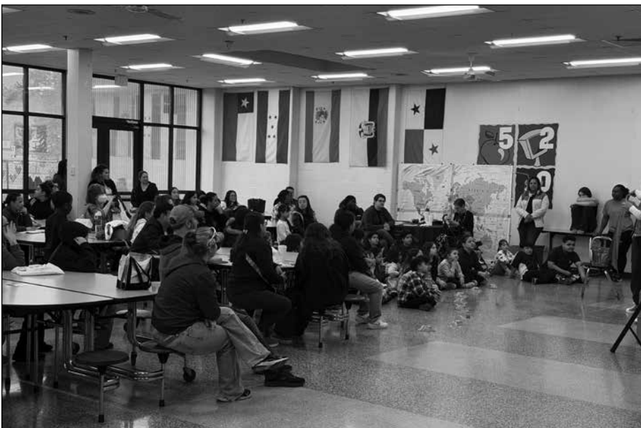
Families at Family University learning about the gardens at Danbury Public Schools